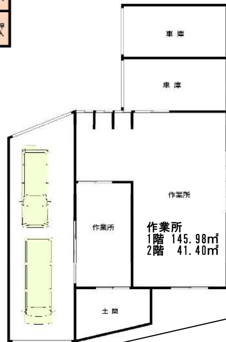
作業所 1階 145.98㎡ 2階 41.40㎡