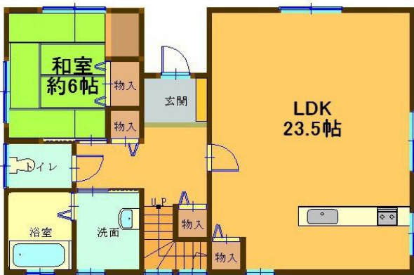
ユニットバス 1.25坪タイプ