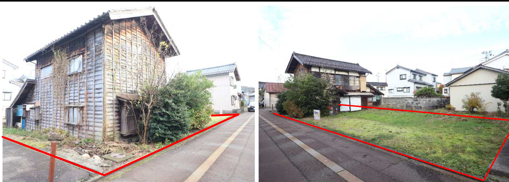
写真の建物を解体した後、更地でのお引渡しとなります