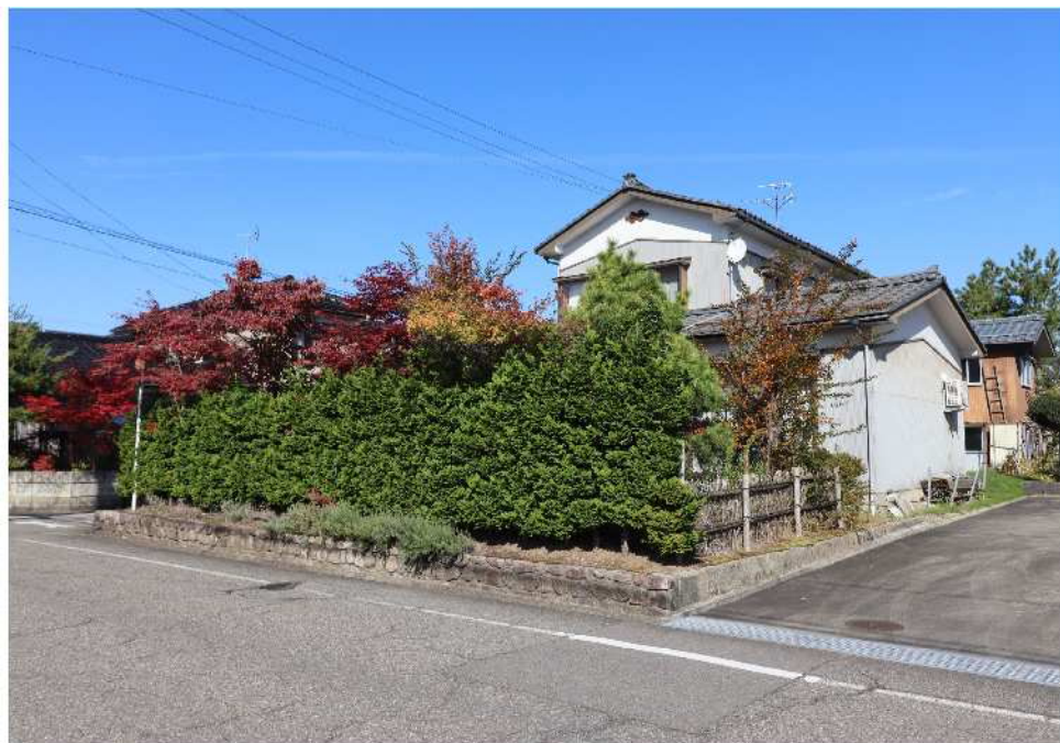
写真の建物は解体し、更地の状態でお引渡しします